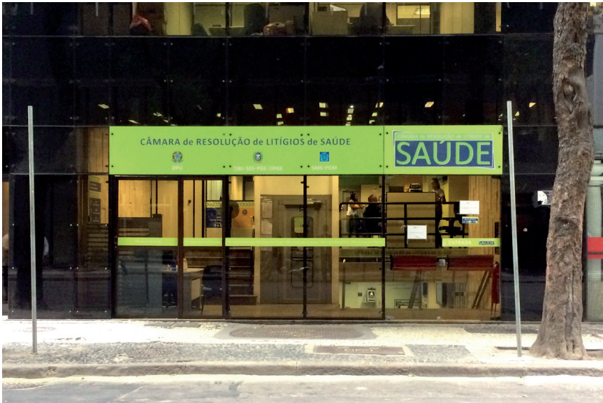
Câmara de Resolução de Litígios de Saúde (CRLS), localizada na Rua da Assembleia, Centro do Rio de Janeiro, inaugurada em 2013