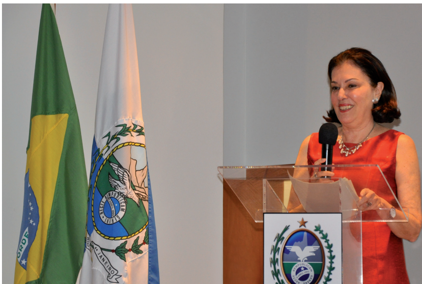
Discurso na inauguração da nova sede da Procuradoria Geral do Estado do Rio de Janeiro, em 2011