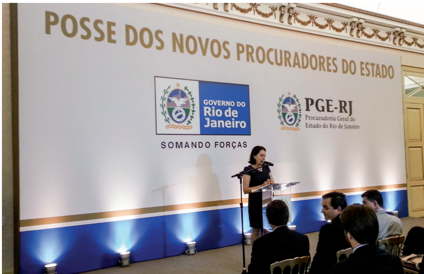
Discurso na posse dos aprovados no 17º Concurso para Procurador do Estado do Rio de Janeiro, no Palácio Guanabara, sede do Governo do Estado do Rio de Janeiro, Laranjeiras, Zona Sul do Rio de Janeiro, em 2013