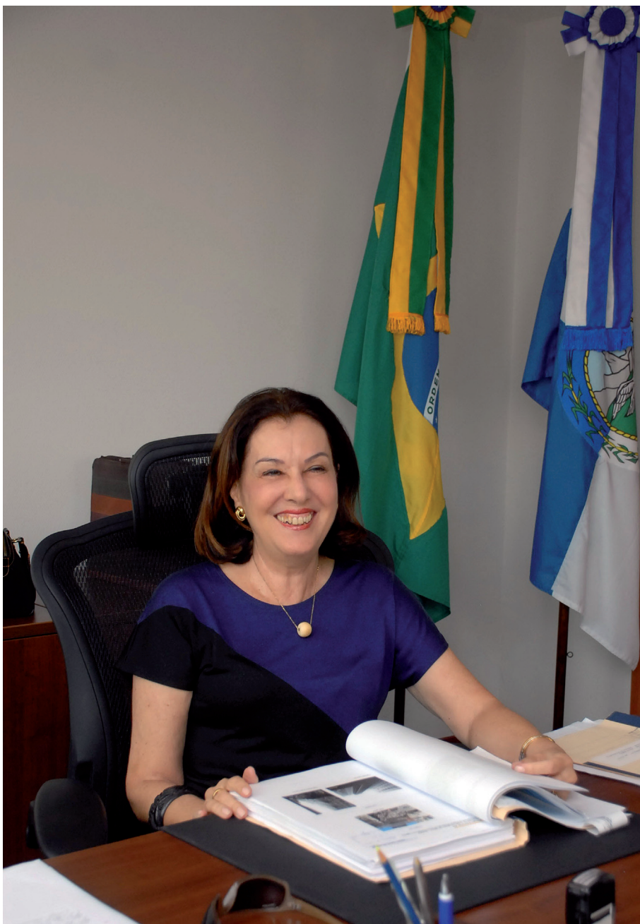
No seu gabinete no edifício-sede da Procuradoria Geral do Estado do Rio de Janeiro