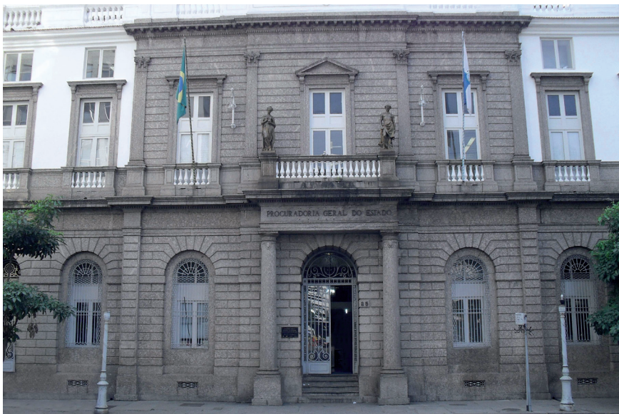
Fachada do antigo edifício-sede da Procuradoria Geral do Estado do Rio de Janeiro, localizado na Rua Dom Manoel, Centro do Rio de Janeiro