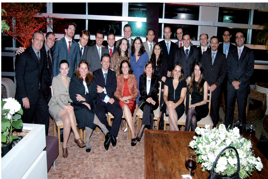
Celebrando a inauguração da sede própria da Procuradoria Geral do Estado do Rio de Janeiro na Capital Federal, Brasília-DF, com outros Procuradores, em 2009